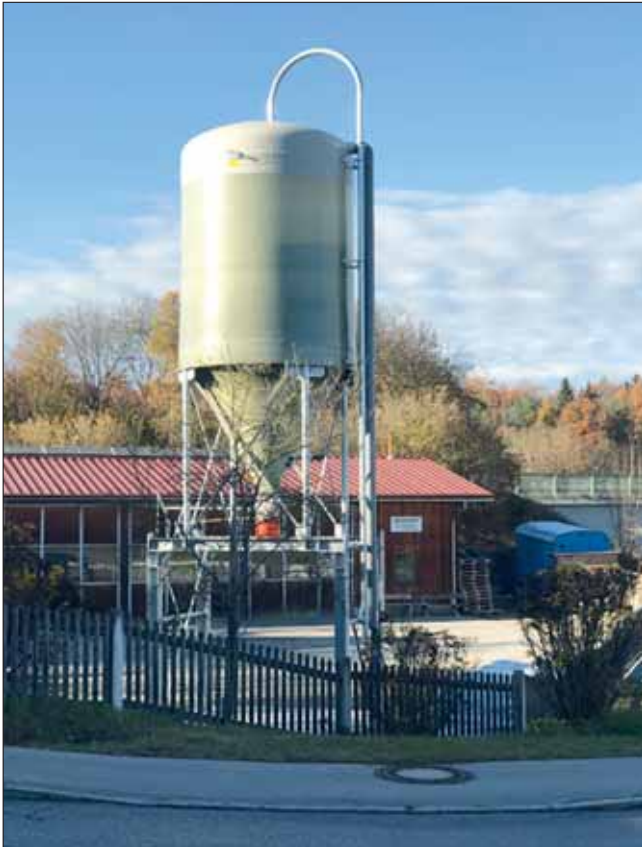
Neues Salzsilo am Bauhof

Der gemeindliche Winterdienst wird bis Mitte März 2019 durchgeführt.